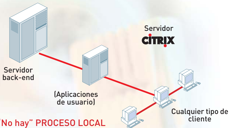
"No hay" PROCESO LOCAL